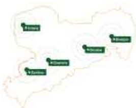
Tagungsorte der Expertenräte. Grafik aus der Sonderausgabe von "KLASSE" des SMK.

Die Bildungsforen setzten sich per Losverfahren aus Schülern, Eltern, Lehrern, Schulleitungen und weiteren Personen aus dem Bildungsumfeld (Verbände, Vereine, Bürger) zusammen. Der Startschuss dieser fiel im Juni 2023 mit einer Auftaktveranstaltung in Chemnitz, bei der sich die Gruppen persönlich kennenlernen konnten und der Ablauf sowie die zu nutzende Plattform vorgestellt wurden. Im Laufe des Sommers mussten dann die 218 Handlungsempfehlungen bewertet werden. Erreichte eine Handlungsempfehlung eine relativ hohe Ablehnungsquote in einer Region, so wurde diese in eine der drei Onlineveranstaltungen übernommen. In Kleingruppen wurde darüber diskutiert und es konnten Pro- und Contra-Argumente zu dieser Handlungsempfehlung verfasst werden. Die Ergebnisse der einzelnen diskutierten Handlungsempfehlungen durften die Bildungsforen der Regionen zudem auf den jeweiligen Abschlussveranstaltungen Herrn Kultusminister Christian Piwarz und weiteren Vertretern des SMK